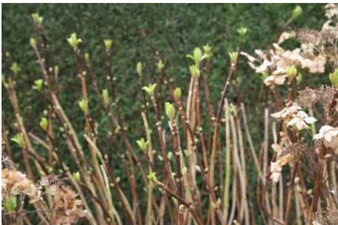
Hortensia op 19 februari 2014

Ook aan de planten in de tuin is goed te zien dat de natuur een maand of meer voor op schema ligt. De groene heesters, zoals de laurier en de glansmispel ( Photinia ), laten nu al volop hun groeipunten zien. De winterharde fuchsia komt normaal gesproken eind april in blad maar nu zit het blad er al aan. De hortensia staat ook in blad. Bij maar een paar graden vorst zullen de bovenste knoppen bevroren. Aangezien daar ook de bloemknoppen zitten zullen ze bij vorst niet of minder goed in bloei komen.